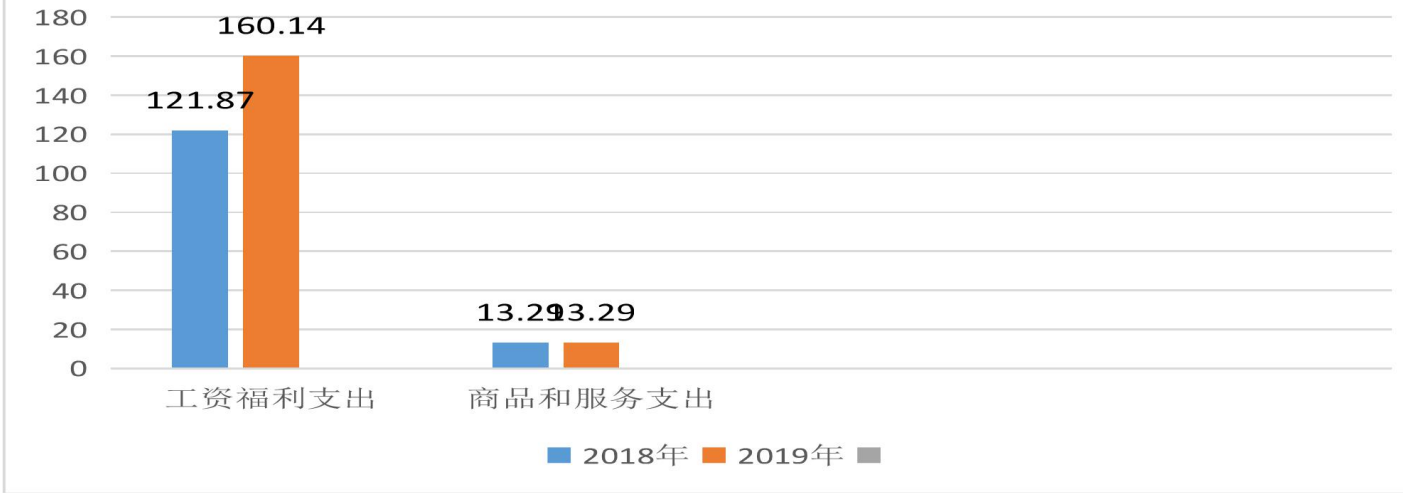
支出按部门经济分类变化情况