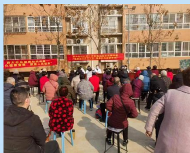
2月3日(正月十三)西城街道西大社区汇邦幸福城小区