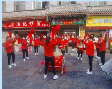
2月5日(正月十五)西城街道仁厚社区