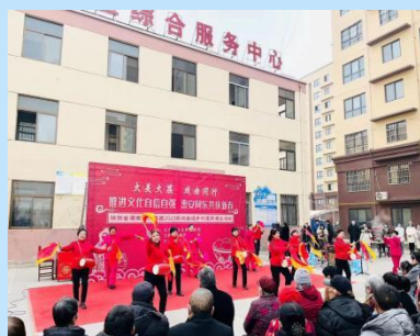
2月5日(正月十五)西城街道西大社区惠安小区