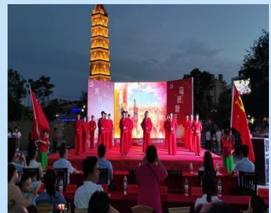
6月29日西城街道西大社区