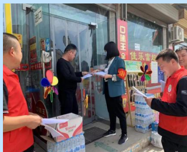
世界环境日宣传志愿服务活动