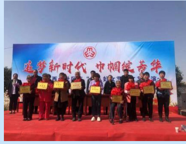
3月8日西长社区庆“三八”妇女节表彰大会暨文艺演出活动