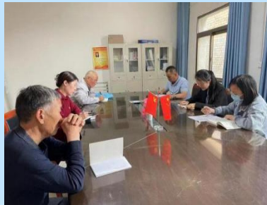
党的二十大精神宣讲走进怡馨养老院