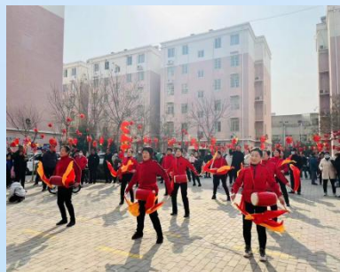
2月4日(正月十四)西城街道西大社区崇业小区