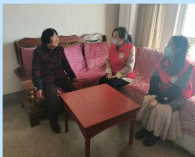
关爱易地扶贫搬迁安置点群众