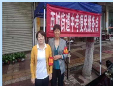
同州中学、冯翊中学考点