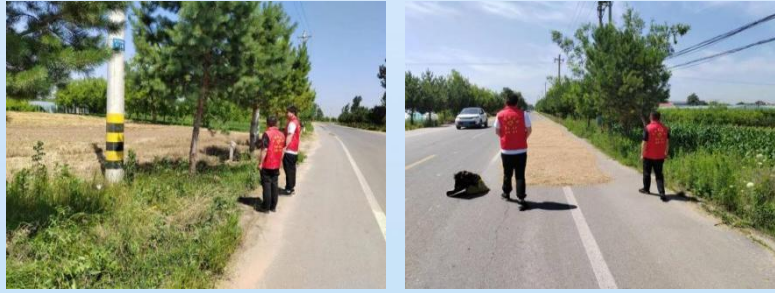
贴心护航“三夏”志愿服务暖心