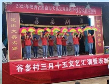
5月4日西城街道谷多村