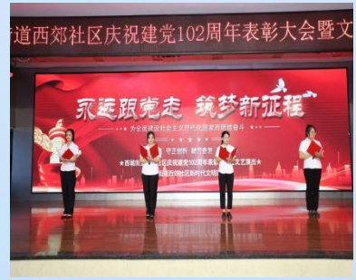
6月28日西城街道西郊社区