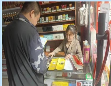
各村开展“扫黄打非”宣传，向群众发放宣传彩页