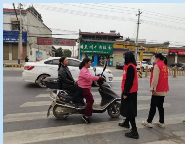
“一盔一带”交通劝导