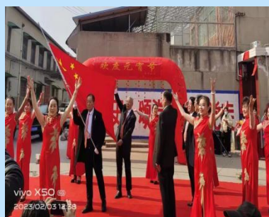
2月3日(正月十三)西城街道南大社区民乐园小区