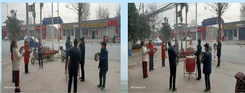
1月26日(正月初五)西城街道南七村