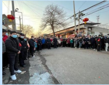
阿寿社火表演志愿者维护现场秩序