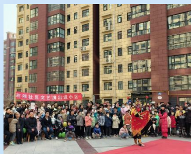
2月3日(正月十三)西城街道西郊社区都市雅苑小区