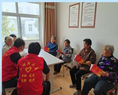
在易地扶贫搬迁安置点开展党的二十大精神宣讲活动