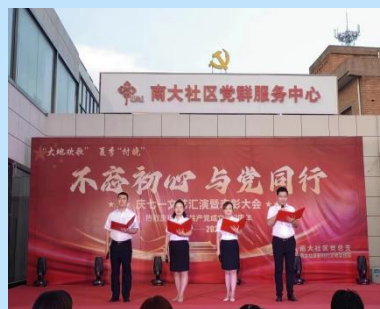
6月26日西城街道南大社区