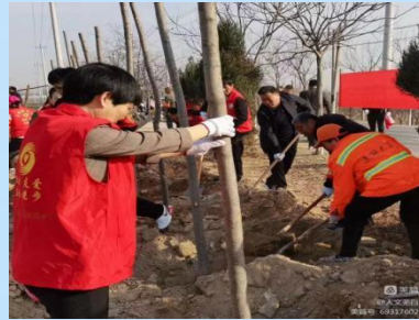
组织开展义务植树活动