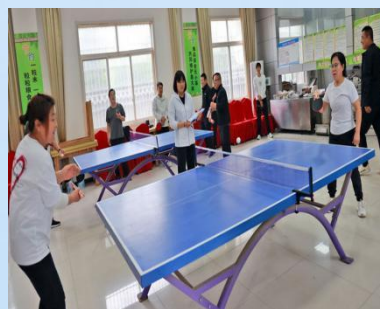
5月5日西城街道办篮球场