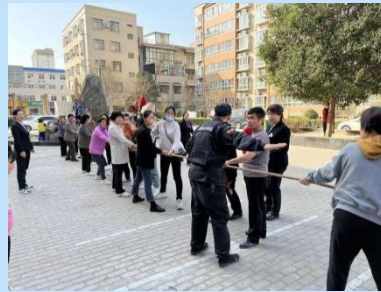
3月8日西城街道西大社区汇邦幸福城小区