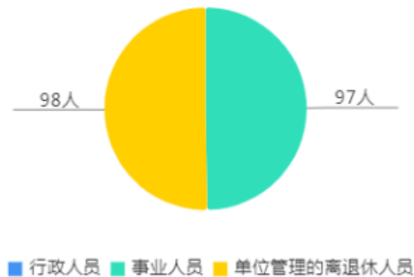
人员情况构成饼图

截止上年底，本单位人员编制97人，其中行政编制0人，事业编制97人；实有人员97人，其中行政0人，事业97人。单位管理的离退休人员98人。