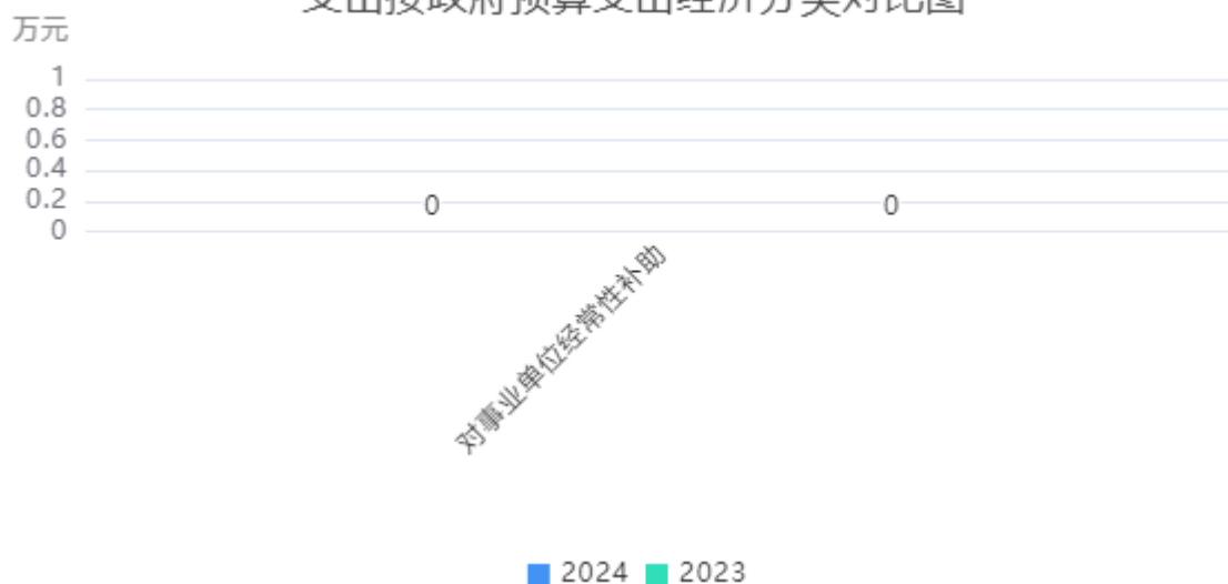
支出按政府预算支出经济分类对比图